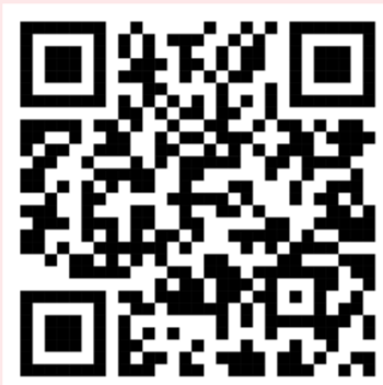
應用程式 介紹影片